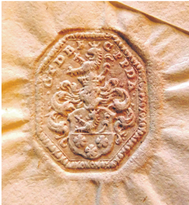
PEČAŤ JURAJA TURZA